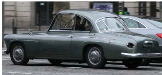
Une petite image pour ceux qui ne connaissent pas 85228